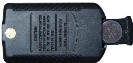
3V纽扣电池 (正极朝背面)